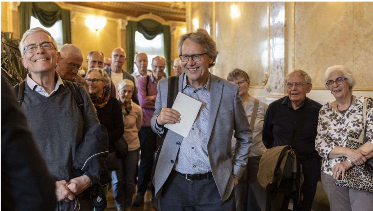
Die Zuhörer:innen erfahren Neues über die Verbindungen von Bubenberg zu Bruder Klaus.