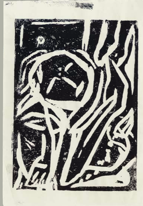
Fotos: Zeichnung, Linolschnitt, Druck