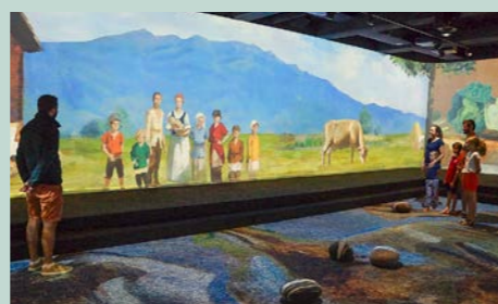
360° Filmerlebnis LUMEUM

Historie trifft Hightech. Im 360° Film-erlebnis LUMEUM im Kloster Bethanien, St. Niklausen wird die Geschichte von Niklaus und Dorothee lebendig. Tauchen Sie ein in die faszinierende Bilder- und Tonlandschaft und spüren Sie der Lebenswelt des Friedensheiligen und seiner Frau nach. Ticketreservierung: lumeum.ch