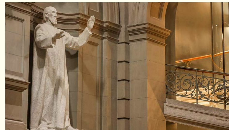
Niklaus von Flüe im Bundeshaus Bern

Nach Fribourg (2023), Solothurn (2024) und Luzern (2025) lädt der Förderverein 2026 zu einer Spurensuche in der Bundeshauptstadt ein. Gemäss Historiker Josef Lang war Niklaus von Flüe mit keinem anderen eidgenössischen Ort so eng verbunden wie mit Bern. Eine besonders starke Beziehung pflegte der Ranfteremit zu Ritter Adrian von Bubenberg, der ihn 1469 bei der Untersuchung des Totalfastens durch den Konstanzer Weihbischof