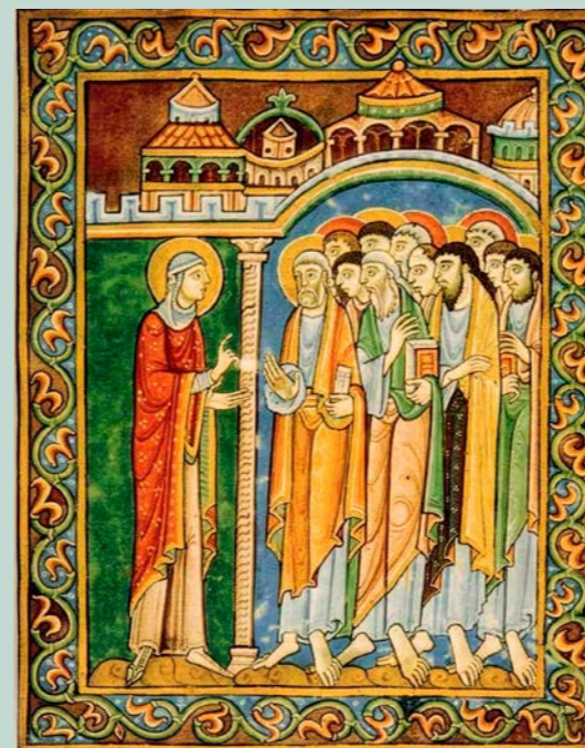
Maria Magdalena auf Augenhöhe mit den Aposteln