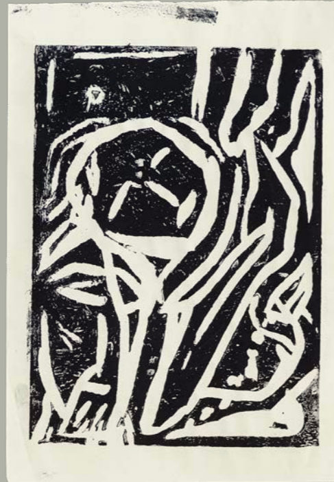
Fotos: Zeichnung, Linolschnitt, Druck