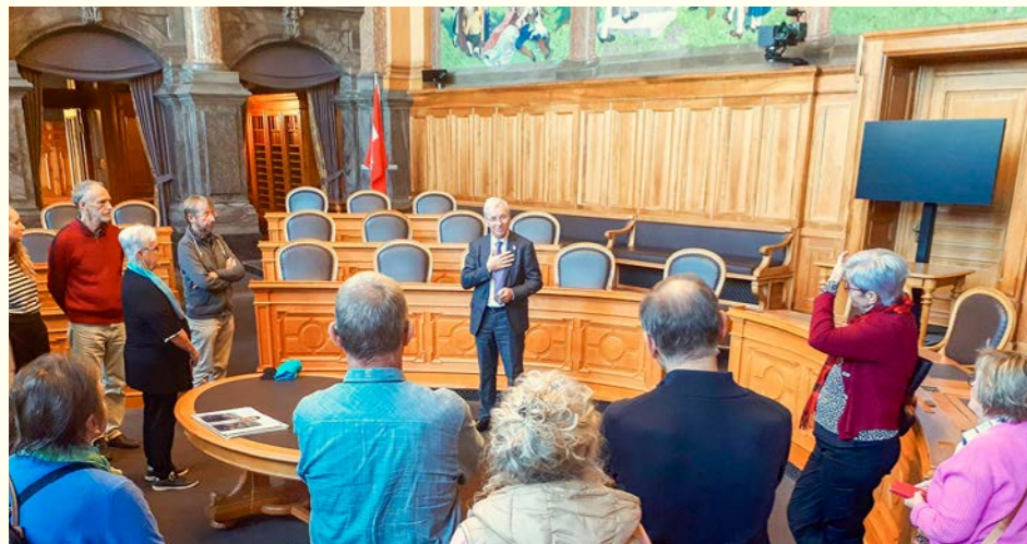
Besuch im Bundeshaus Bern, Führung mit Ständerat Erich Ettlín

Gesprächsmöglichkeit sehr geschätzt wird. Diese Angebote möchten wir auch während der Wallfahrtsaison 2026 weiterführen.