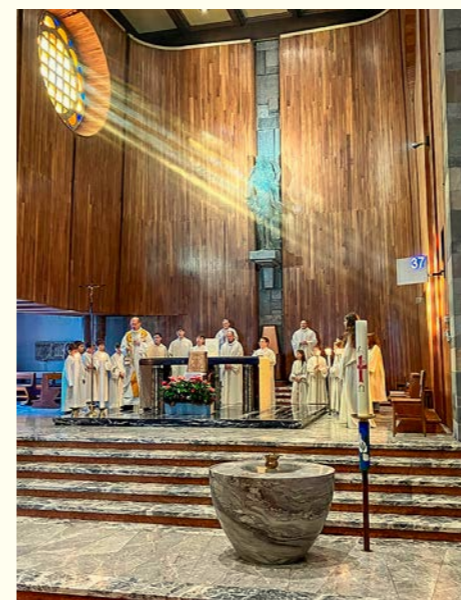
Segnung des Radbildes im Gottesdienst in Lugano-Besso

Wir brauchen dringend Frieden! Im Friedensheiligen Niklaus von Flüe haben wir einen mächtigen Fürsprecher bei Gott. Im Tessin wurde deshalb eine Gebetsoffensive für den Frieden