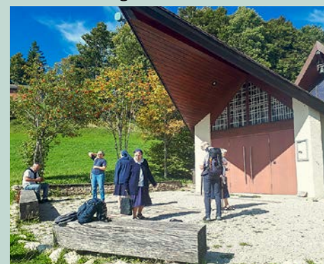
Teilnehmende vor der Bruder Klaus-Kapelle Weissenstein

Am 20. September fand die Generalversammlung von «Les amis de Frère Nicolas» auf dem Weissenstein auf 1200 m.ü.M. statt, mit Weitblick vom Säntis bis zum Mont Blanc. Der Verein legt Wert darauf, die jährliche Zusammenkunft an einem wechselnden, mit Bruder Klaus verbundenen Ort durchzuführen. 2025 bot sich die ökumenische Bruder Klaus-Kapelle auf dem Hausberg von Solothurn an.