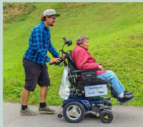
Fahrt mit dem begleiteten Ranft-Mobil

Die Reservationen der Fahrten erfolgen durch das Schweizerische Rote Kreuz Unterwalden. Ein geschultes Team von zehn Männern stellt sich aktuell für die Ranft-Mobil-Fahrten zur Verfügung. Sie bereiten die Fahrstühle zur gewünschten Zeit beim Wohnhaus vor, begleiten und lenken die Fahrten und parkieren das Elektrofahrzeug nach der Rückkehr wieder in der «Ranft-Mobil-Garage» auf dem Flüeli. Der Verein sucht Verstärkung. Sind Ihnen der Ranft und Bruder Klaus und Dorothee wichtig? Wohnen Sie in der Zentralschweiz und möchten sich zwei bis drei Stunden monatlich freiwillig engagieren, dann melden Sie sich direkt beim Vereinspräsidenten Rolf Müller, verein@ranft-mobil.ch. Weitere Angaben auf: www.ranft-mobil.ch