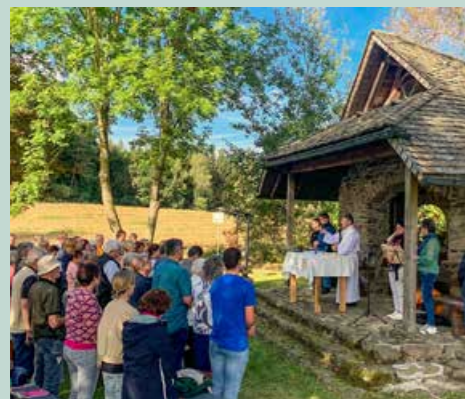
Festa patronale, 22 settembre 2024

Dopo la catastrofe della seconda guerra mondiale il KLJB e il KLB della Germania nel 1951 hanno scelto Nicolao della Flue come loro santo patrono.