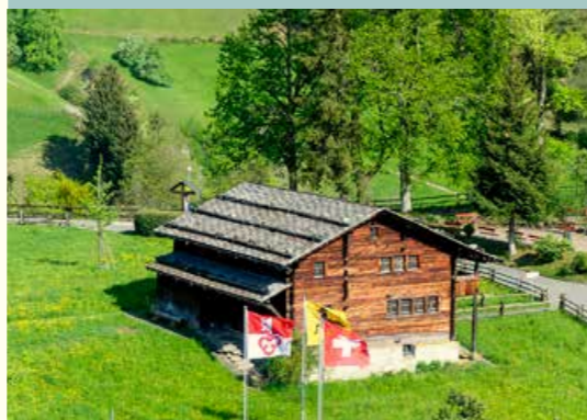
Le due storiche case, nell'immagine la casa di Nicolao e Dorotea, sono aperte ai visitatori tutti i giorni da aprile a fine ottobre e in inverno su richiesta.

Gli assistenti e le assistenti delle due case di Flüeli si mettono al servizio dei pellegrini in modo particolare. Accolgono ospiti da vicino e da lontano, raccontano la storia delle case, fanno in modo che sia tutto in ordine e forniscono informazioni su Nicolao e Dorotea. Con grande impegno 15 persone si dividono i vari compiti che nel 2024 si sono rivelati pari a 2470 ore di lavoro. Dal 2020, l'assunzione e la formazione del personale delle case, la ripartizione dei compiti, ecc. sono regolati da un accordo tra la Fondazione «Kapellenstriftung Flüeli-Ranft» e l'Associazione Promotrice.