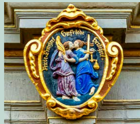
La giustizia e la pace si baciano (Sal 85,11)

È come se l'apostolo Paolo avesse scritto queste parole apposta per Nicolao della Flue. Nel Ranft, per lui il cibo e le bevande non erano una priorità. Lì trascorse gli anni in silenzio pregando e digiunando e diventò un grande consigliere e pacificatore. Decine di migliaia di persone da mezza Europa vennero da lui con le loro richieste concrete. Ancora oggi. Preoccupazioni sulle guerre, lotte e conflitti su larga e piccola scala hanno giocato e giocano tuttora un ruolo importante. Ma la pace non può esistere senza giustizia. Nicolao della Flue lo sapeva bene. «La pace è sempre in Dio»,