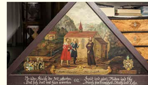
Messaggeri da Lucerna cercano consiglio al Ranft (copia del dipinto bruciato del Kapellbrücke)

Nel 2025 si concluderà il progetto triennale «In cammino con la pace con Fratello Nicolao». Il messaggio dal Ranft è stato portato a Friburgo nel 2023 e a Soletta nel 2024, in due cantoni che hanno un legame speciale con il pacificatore Nicolao della Flue. Grazie al suo lavoro di mediazione durante la Convezione di Stans nel 1481 i confederati in conflitto sono scesi a un accordo e le città di Soletta e Friburgo sono state accettate nell'antica Confederazione. La pace fu raggiunta.