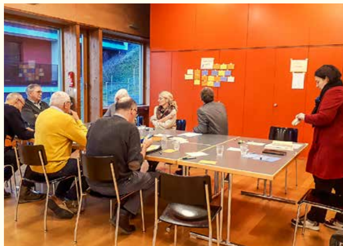
Ritiro 30 novembre 2024

di amministrazione si è incontrato il 16 ottobre per la sua riunione autunnale. Alcune osservazioni sui punti all'ordine del giorno offrono uno sguardo sul lavoro dell'associazione: