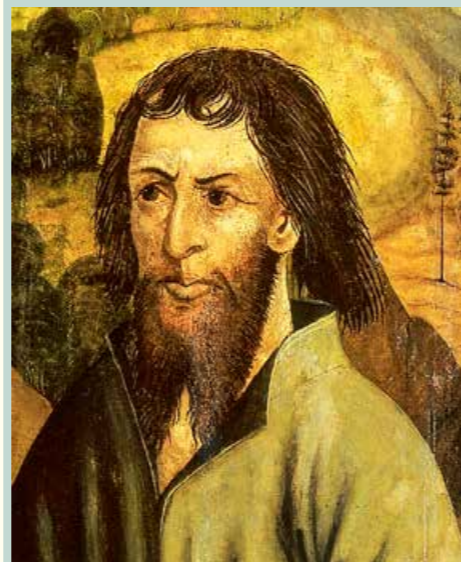
Dipinto più antico di Nicolao della Flue (nel museo)

«La pace non è tutto, ma senza pace tutto è niente». Sono parole dell'ex-cancelliere tedesco Willy Brandt, che nel 1971 ricevette il premio Nobel per la pace. Anche nella Bibbia viene detto che la pace da sola non è tutto. Nell'Antico Testamento si legge «L'opera della giustizia sarà la pace e l'azione della giustizia, tranquillità e sicurezza per sempre.» (Is 32,17). Nel Nuovo Testamento Paolo scrive: «Perché il regno di Dio non consiste in vivanda né in bevanda, ma è giustizia, pace e gioia nello Spirito Santo.» (Rom 14,17) Nel linguaggio di oggi il versetto si potrebbe rendere anche in questo modo, si tratta di «vivere una vita secondo la volontà di Dio e di lasciarsi riempire di pace e di gioia, doni dello Spirito Santo.»