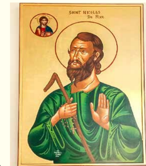
Icona di Nicolao della Flue nella chiesa di Damour

Oltre 330 luoghi commemorativi, chiese e cappelle su bruderklus.com/netzwerk