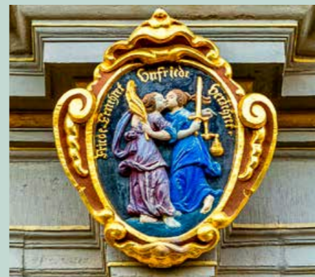
La justice et la paix s'embrassent (Ps 85,11)

C'est comme si Saint Paul avait écrit cela pour Frère Nicolas. Pour lui au Ranft la question littéralement n'était pas de manger et de boire. Il a passé des années dans le silence, la prière et le jeûne et est devenu un grand conseiller et homme de paix. Des dizaines de milliers de personnes de presque toute l'Europe venaient le voir avec des préoccupations précises, et viennent encore aujourd'hui. Les soucis à cause de la guerre, de conflits et de discorde jouaient et jouent encore un rôle important, en grand comme en petit. Mais il n'y a pas de paix sans justice. Frère Nicolas le savait. «La paix