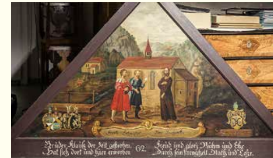
Des messagers de Lucerne cherchent conseil au Ranft (copie de l'image brûlée du pont de la chapelle)

2025 verra la fin du projet de 3 ans «En chemin pour la paix ... avec Frère Nicolas». Le message du Ranft a été porté en 2023 à Fribourg et en 2024 à Soleure, deux cantons qui ont une relation particulière avec l'homme de paix Nicolas de Flue. Grâce à sa médiation au Covenant de Stans en 1481 les confédérés divisés ont trouvé un accord et intégré les villes de Soleure et de Fribourg dans la Confédération. La paix s'est installée.