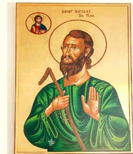
Icone de Frère Nicolas dans l'église de Damour

Dans le monde entier plus de 330 lieux de souvenir, églises et chapelles sur bruderklaus.com/netzwerk