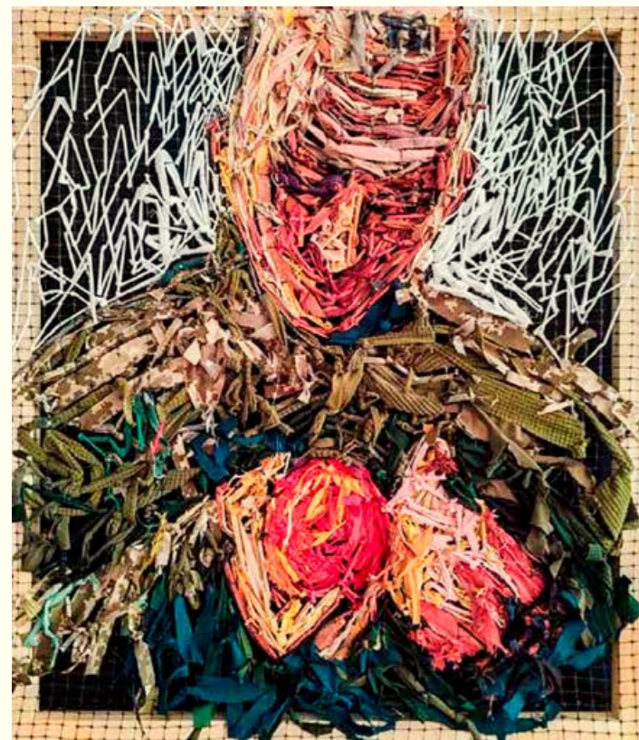
Andriy Naboka, «Freedom», 100×90 cm