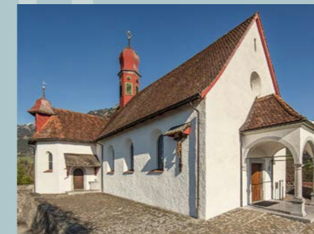
La cappella di Flüeli

Sarà pubblicato un opuscolo commemorativo e il 4 novembre si terrà una messa solenne per questo giubileo e per la festa di San Carlo Borromeo.