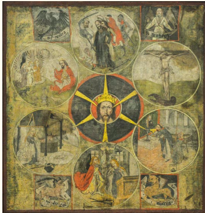
La tavola di meditazione di Nicolao della Flüe, 1475/80

La tavola di meditazione di Nicolao della Flüe è ancora oggi una testimonianza pittorica davvero unica che il Santo adottò come manifesto della sua esperienza spirituale. La tela è stata oggetto di studi specifici a carattere teologico e scientifico (Heinrich Stirnimann 1981, Werner T. Huber 1981) e ha conosciuto un'ampia diffusione come velo quaresimale in Svizzera per Sacrificio Quaresimale e Pane per Tutti (1981 e 1987) e in Germania per Misereor (1980 e 1998).