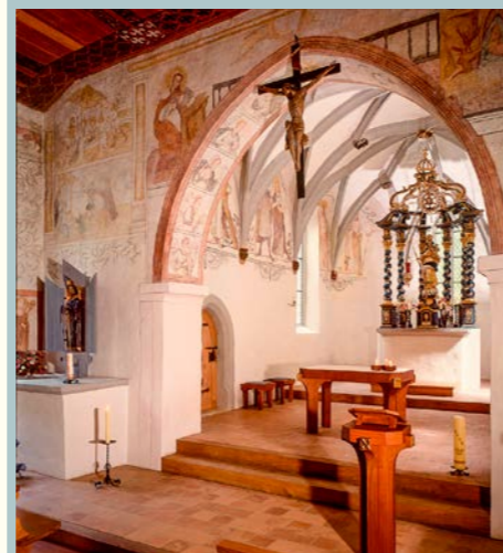
La cappella inferiore di Ranft

Da quest'anno e a ritmo biennale, invitiamo al pellegrinaggio tutte le persone che dispensano servizi pastorali e che capiscono il tedesco. La prima occasione sarà quella del 17 settembre 2018. La celebrazione eucaristica a Ranft sarà officiata alle 11.30 da Mons. Heinrich-Maria Burkard, che nel pomeriggio ci parlerà del cammino delle visioni di Fratello