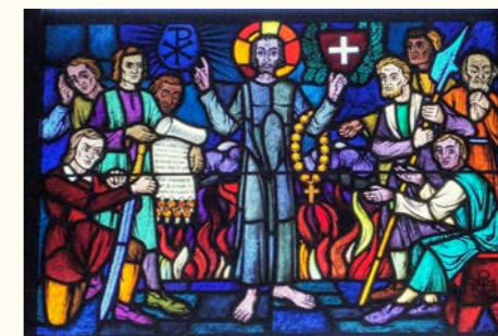
Fratello Nicolao il paciere, vetrata della chiesa dei cappuccini a Briga

Quella di Britz, ai margini meridionali di Berlino, è stata eretta dopo la caduta del muro e consacrata il 2 dicembre 1989. Come si nota osservando l'abside del piccolo campanile, l'architetto