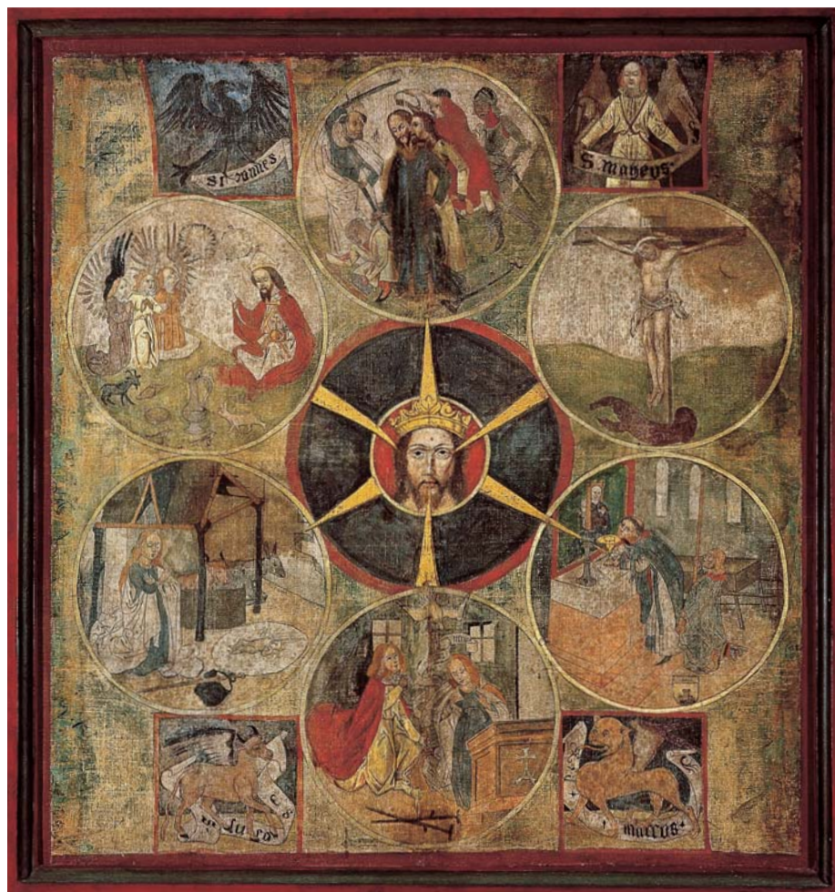
In der Pfarrkirche Sachseln ist eine originalgetreue Kopie des 1475/80 gemalten Meditationsbildes von Bruder Klaus zu sehen.

Es trifft sich gut, dass das Jahr der Barmherzigkeit mit dem Lesejahr des Lukas-Evangeliums zusammenfällt. Lukas ist der Evangelist, der uns in vielen Bildern und Geschichten von der Menschlichkeit und Barmherzigkeit Gottes erzählt. Ohne Lukas hätten wir keine Weihnachtsgeschichte und von Maria wüssten wir nur wenig. Die Barmherzigkeit Gottes begegnet uns vor allem in den Gleichnissen, die Lukas beschreibt. Zum Beispiel vom barmherzigen Samariter: Da ist einer überfallen worden und liegt am Rand der Strasse. Leviten und Schriftgelehrte gehen an ihm vorbei und lassen ihn