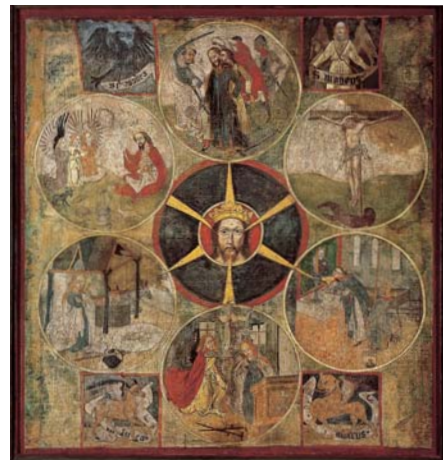
Image de méditation du Frère Nicolas

L'image de méditation du Frère Nicolas est un témoignage magnifique de la méditation chrétienne occidentale. Elle a pour origine les cercles mystiques qui influencèrent de façon décisive l'héritage intellectuel des grands professeurs du mysticisme chrétien (Eckhart, Tauler, Seuse), qui ont fortement influencé le développement religieux du Frère Nicolas.