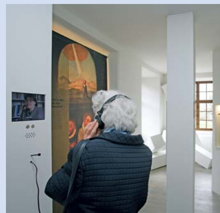
L'exposition de base supervise la vie de Frère Nicolas et son action.

L'exposition de base «Nicolas de Flue – médiateurs entre les mondes» honore le mystique, le politicien, le saint populaire et l'artisan de paix. Elle supervise sa vie et son action. Le rayonnement de Nicolas de Flue atteint les hommes d'aujourd'hui. L'exposition est variée et touche les différents sens. Des objets originaux de grande valeur, des images statiques et mobiles, les informations et la prise de position dans des stations